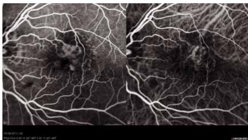
Figur 3. viser en simultan optagelse af fluorescein (venstre) og indocyaningrønt (højre) hos en patient med en subretinal karydannelse.