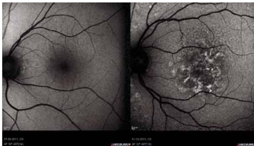
Figur 1 viser et billeder med normal autofluorescence til venstre og på billedet til højre ses et billede fra en patient med AMD og øget autofluorescence, hvilket skyldes ophobning af lipofuscin i RPE.