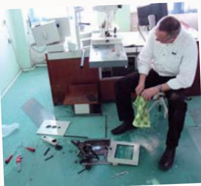
En af Udos bedrifter: Denne gamle øst-Zeiss spalte-lampe kom hurtigt i funktion igen!

Den nye model, der ansøgte var en Visulas 532S Combilaser fra Zeiss. Den giver en værdifuld ekstra kvalitet, med nu 2 bølgelængder. Ved sekventiel behandling, primært med 532 nm grøn kontinuert laser, lettes YAG perforation i asiatiske øjne med tykt brunt irisvæv. YAG udstyret er nødvendigt til behandling af øjne med efterstær. Grøn laser muliggør iridoplastik, der formindsker vævstykkelsen i iris periferien, et indgreb af betydning i øjne med plateauiris. Samme laser anvendes til trabekuloplastik, for behandling af åbenvinklet