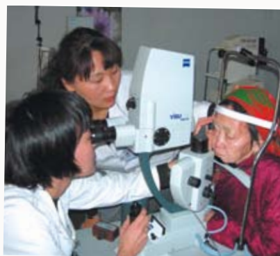
Unge kollega instrueres.