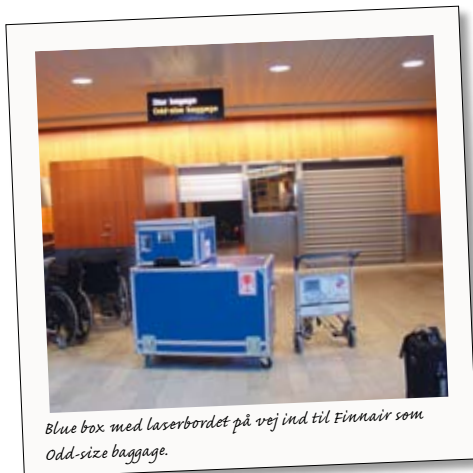
Blue box med laserbordet på vej ind til Finnair som Odd-size baggage.