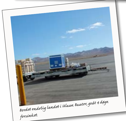
Bordet endelig landet i Ulaan Baator, godt 4 døgn forsinket.