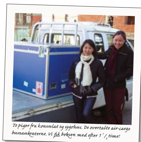
To piger fra konsulat og sygehus. De overtalte air-cargo bureaukraterne. Vi fik broksen med efter 1 1/2 time!

bundne blindeproblemer, med mulighed for profylakse, specielt gennem tidlig behandling med YAG-laser. Vinkellukningsglaukom viste sig som et hovedproblem af stor betydning for blindeforekomsten.