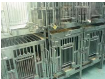
Top-moderne faciliteter til dyreeksperimentelle studier (her ses aber)

laboratoriet finder man confocal laser scanning mikroskop, HPLC-MS, flowcytometer, udstyr til protein og nucleinsyre analyse etc., mens den kliniske afdeling er udstyret med bla. ultralyd biomikroskopi og bageste og forreste afsnits OCT.