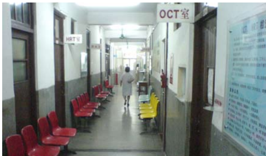
Centeret er udstyret med det nyeste udstyr til kliniske undersøgelser

I 2008, samme år som de olympiske lege bliver afholdt i Beijing, vil landet være vært for den XXXI oftalmologiske verdenskongres i Hong Kong.