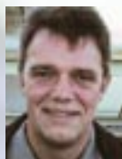
Af Niels Ehlers & Jesper Hjortdal