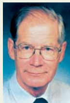
Af Mogens Norn Medicinsk Museion, København

Vandbriller kan sammenlignes med de i dag så aktuelle dykkerbriller. Vandbrillen og patienten er omgivet af luft, mens rummet mellem brille og øje er fyldt med saltvand. Dykkerbrille og dykkeren er derimod nedsænket i saltvand, mens rummet mellem linse og øje er luftfase.