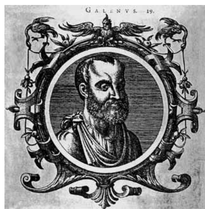
Fig. 1 Portræt af Galenus, lånt fra Duke-Elder 4