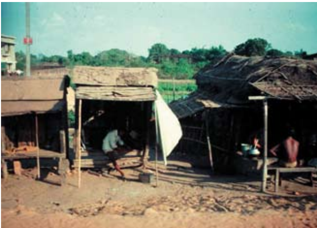
Parcelhuse langs hovedvejen.

lingslandene. I Vesten beskæftiger vi os med vore egne problemer (glaukom, makuladegeneration og diabetes).