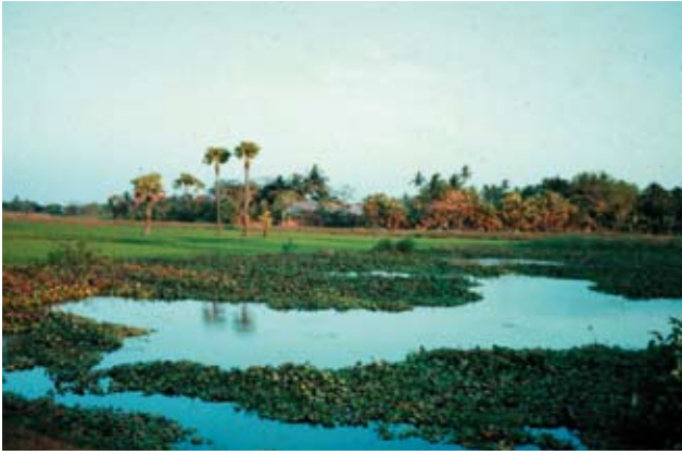
Smukt ser det ud.