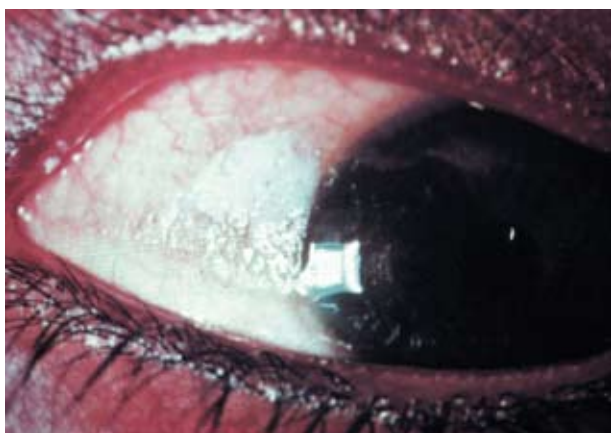
Bitot's plet. Udtørring og keratinisering af conjunctiva bulbi.