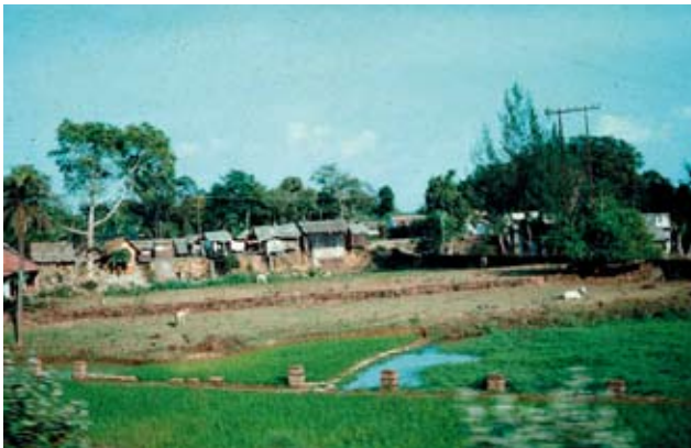
Tættere på fornemmes den dårlige hygiejne.