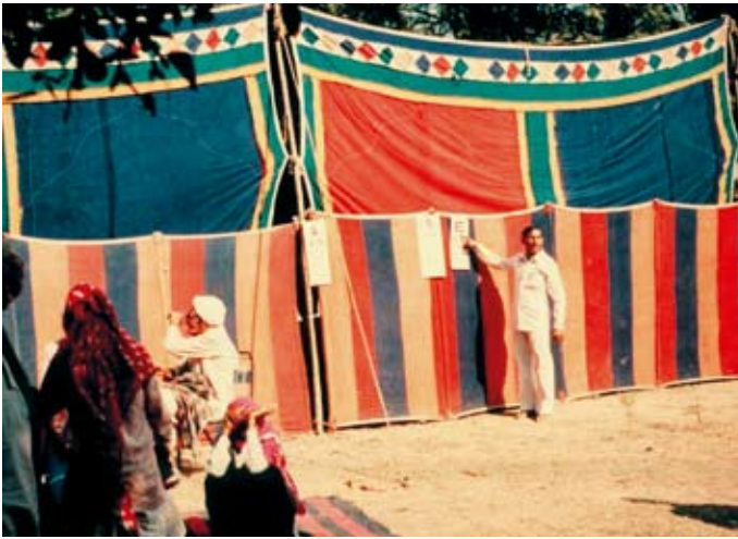
Forundersøgelse til kataraktoperation.