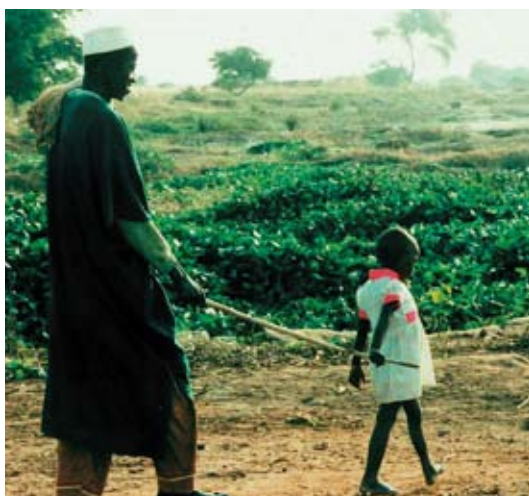
Blindeforsorg i Afrika. Endemisk forekomst af onchocerciasis.

Fra USA og flere europæiske lande ved vi, at der er et mætningspunkt omkring 1% pr. år. Vi opererer i Danmark 50.000 pr. år, og med samme regnestykke som ovenfor, er der derfor et globalt behov for >50 mio. katarakt operationer pr. år! Det lyder voldsomt, men hvor er det egentlig, den største begrænsning ligger. En kataraktoperation koster omkring 4000 kr. i Danmark. Hvis vi sætter prisen globalt til 1000 kr., giver det en samlet udgift på 50 mia. kr. Det er mange penge, men i forhold til de samlede sundhedsudgifter er det