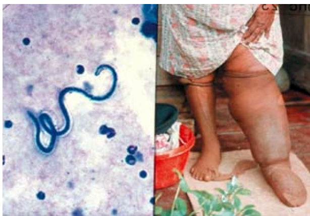
Onchocerciasis. Voksen orm, blokeret. Lymfedrainage.